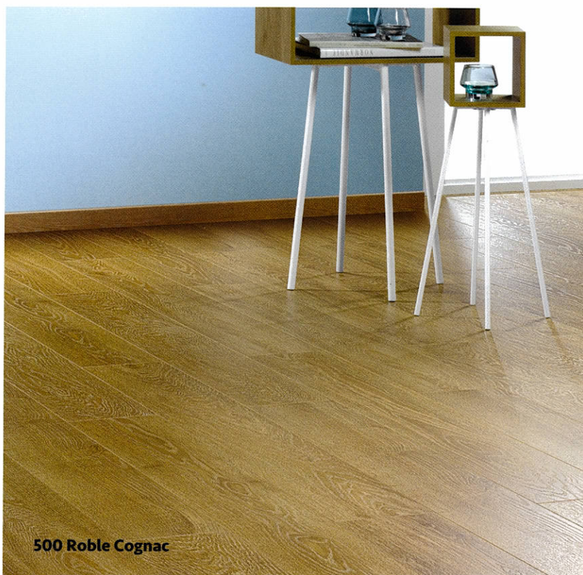
500 Roble Cognac